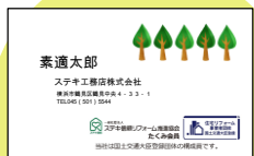
ロゴマーク使用例